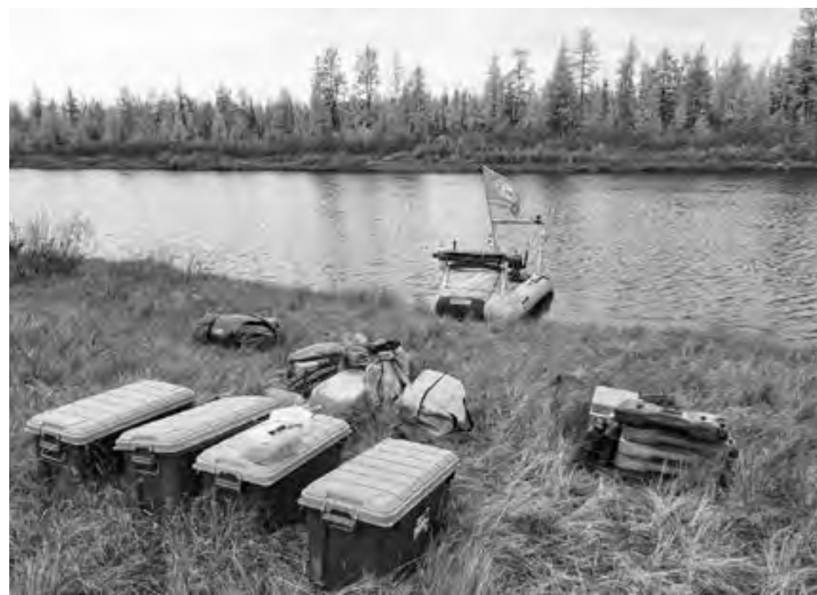
Лодка собрана и готова к приключениям.