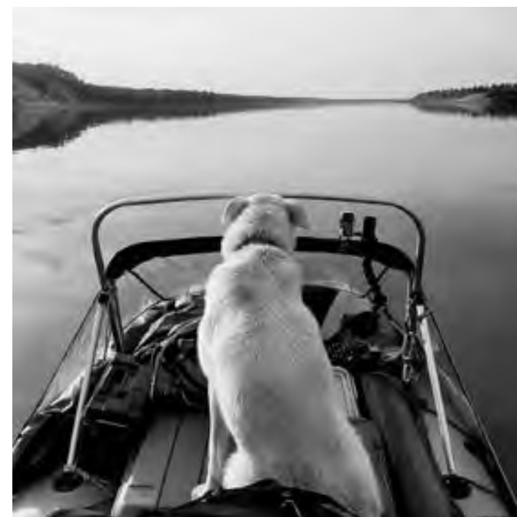
Приближаясь к реке Лене.