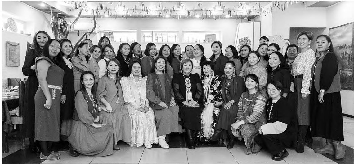
«Кэрэ эйгэ» – год вместе.

Были организованы выезды в г. Ленск, п. Нахара, с. Вилючан, с. Слюдюкар, с. Сунтар и с. Амга. Регулярно проводятся мероприятия на якутском