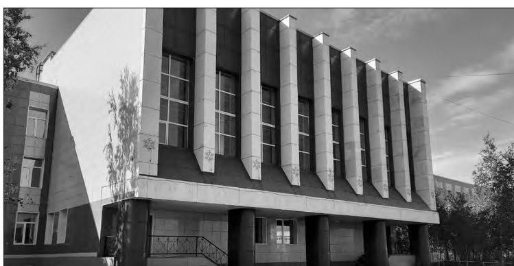
📷 Наши дни. Школа ждет учеников

современный вид как внутри, так и снаружи, созданы все условия для обучения, интеллектуального и творческого развития подрастающего поколения.