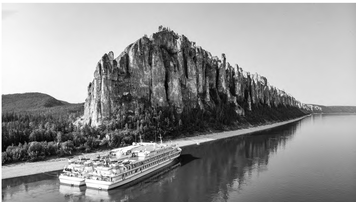
📷 Ленские столбы.

Онкоцентр в Якутске – это уже второй крупный медицинский объект, открытый президентом России Владимиром Путиным.