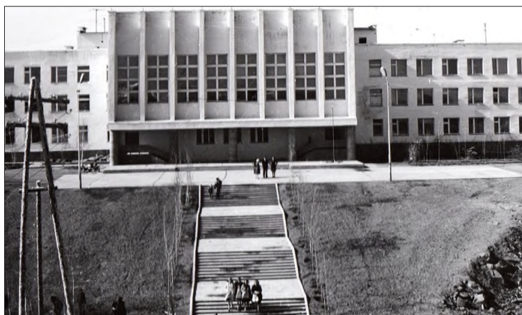
📷 Здание школы №3