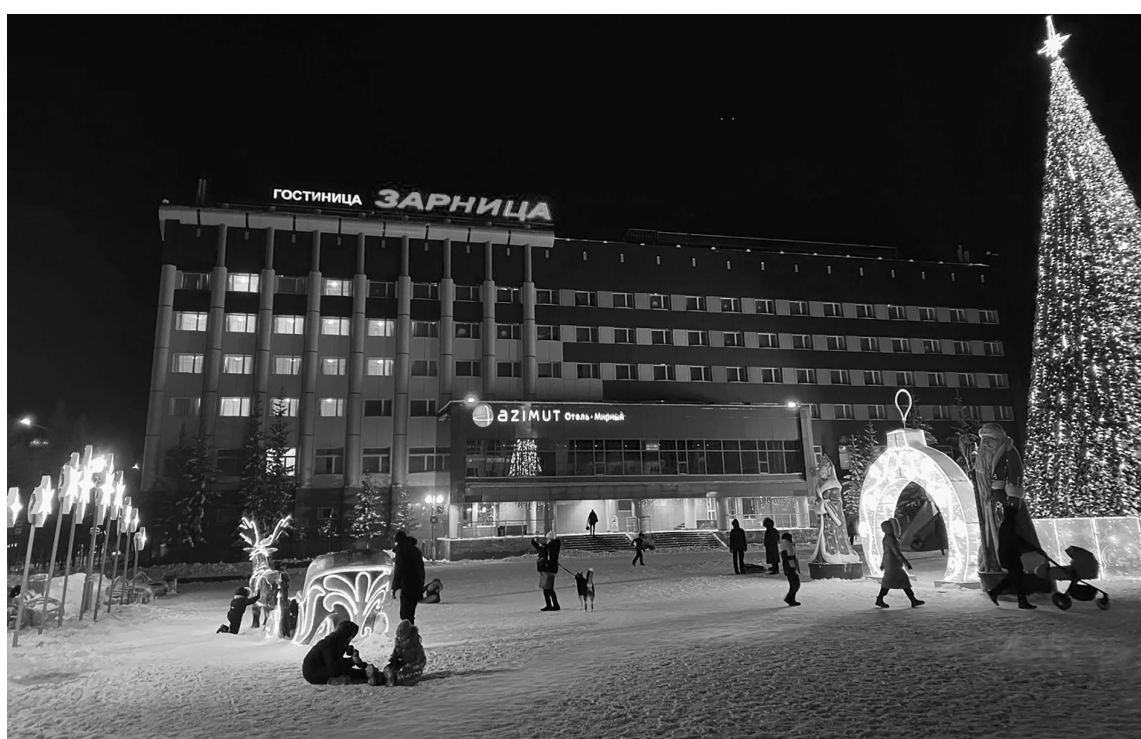
AZIMUT-отель вместе со своими гостями зажгут сердца, включив свет в одних номерах и выключив – в других

«Вечером в течение часа по местному времени – с 19:00 до 20:00 фасад отеля в Мирном украсят огромным световым сердцем. AZIMUT-отель вместе