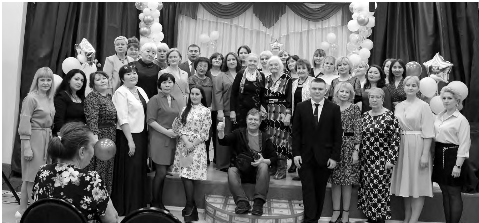
📷 Дружный коллектив школы.

Не так давно 60-летний юбилей отметила школа №3 п. Чернышевского. В связи с этим хочется рассказать об ее истории. Она очень интересна и неразрывно связана с Вилуйской ГЭС, которая стала судьбой для многих жителей поселка.