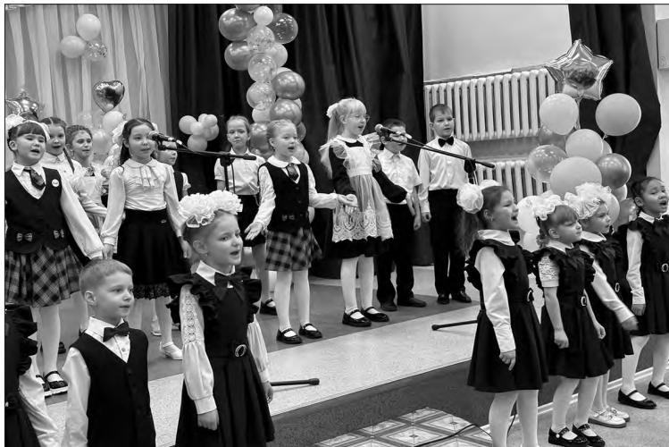
📷 Школа не может существовать без детских голосов

Сегодня, несмотря на почтенный возраст, школа имеет