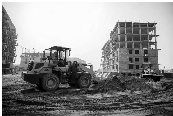
📷 Строительная площадка в Якутске