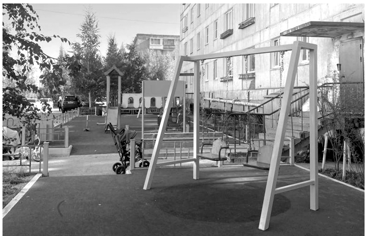
Дворовая территория по улице 50 лет Октября, дом №5