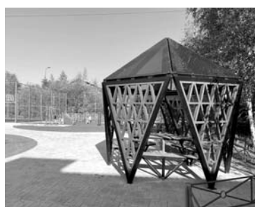
Двор по ул. Бобкова (мкрн «Заречный»)