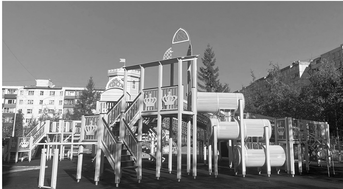
Новая площадка по программе социального партнерства, расположенная по ул. Тихонова, 12

В рамках социального партнерства с компанией РНГ по ул. Тихонова, д. 12/1 идут работы по благоустройству. Сроки сдачи – конец августа 2023 года. Старая резная площадка из дерева, которая стояла в этом дворе, сейчас вывезена на склад и ожидает реставрации. В будущем ее установят в городском парке не как детский городок, а как архитектурные формы. (Уникальные деревянные скульптурные композиции ручной работы были установлены в Мирном более 30 лет назад на трех площадках: по улицам Тихонова, Советской и в городском парке. Композиция «Городок» по ул. Тихонова – единственная сохранив-