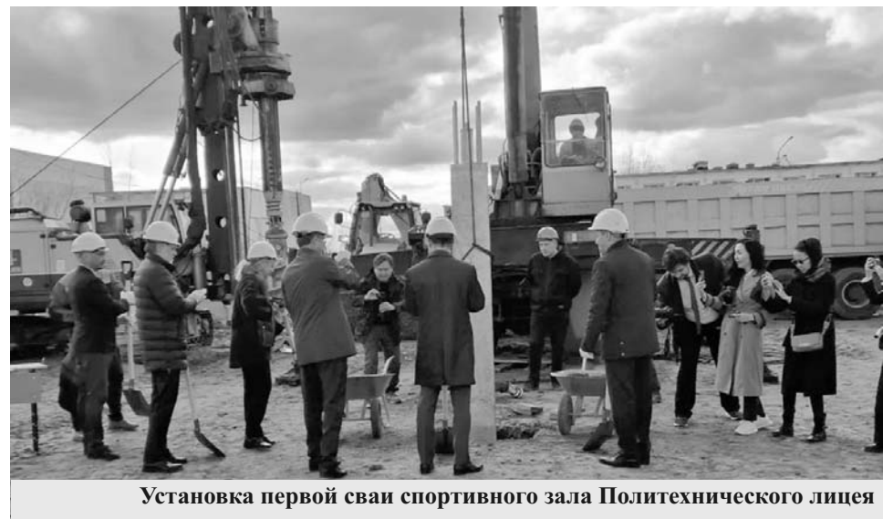
Установка первой сваи спортивного зала Политехнического лицея