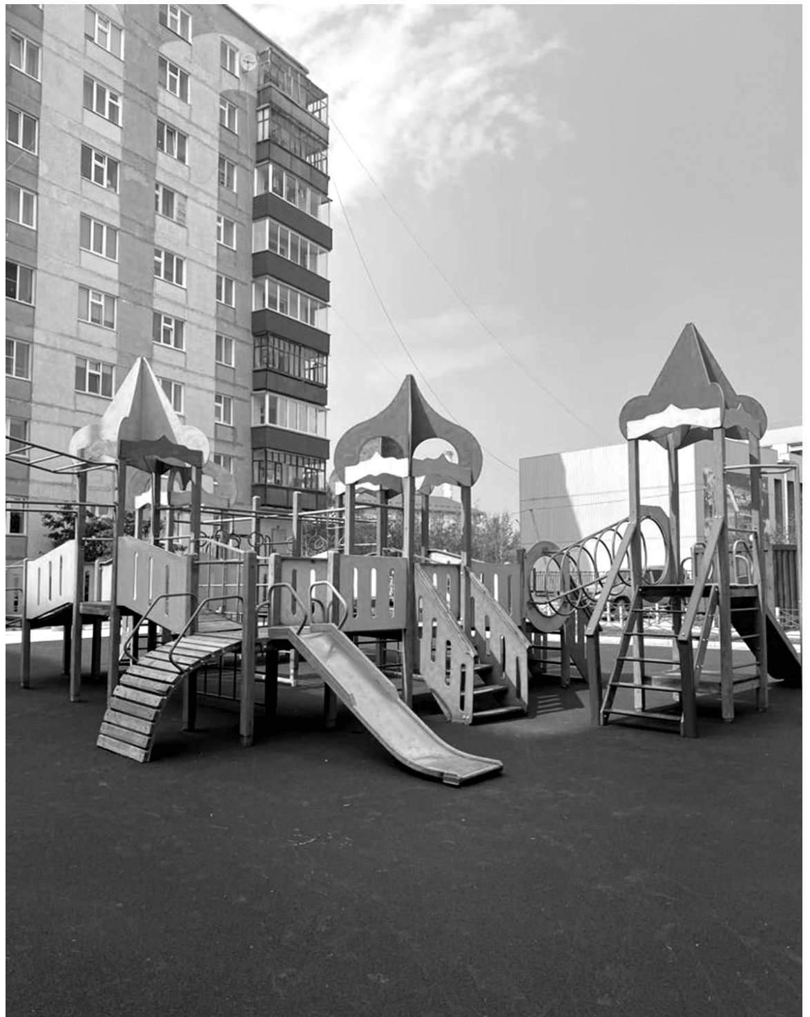
Игровой городок по улице Солдатова, дома №11, №13