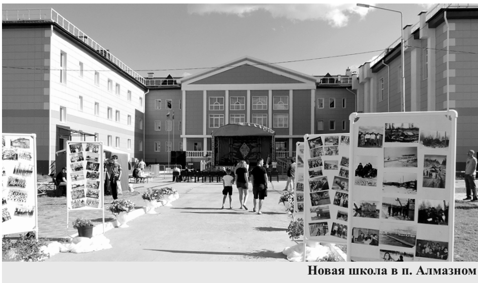
Новая школа в п. Алмазном