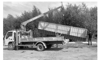
Мусорная ниша на Вилюйском кольце

В окрестностях Мирного большая работа ведется по вывозу мусора с несанкционированных свалок дачных секторов. Руководитель муниципалитета отметил, что за июль коммунальные службы вывезли уже более 9 тыс. куб.м мусора. Для сравнения: в прошлом году за целый сезон вывезли только 3 тыс. куб.м. Большинство свалок несанкционированные, по этой причине глава в очередной раз призвал жителей г. Мирного уважать чужой труд, следить за чистотой и не мусорить. К тому же для этого созданы все усло-