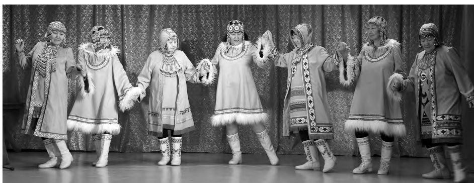
У сьюльдюкарских бабушек энергии и жизнелюбия не отнять.

Затем начался концерт, на котором выступили клубное