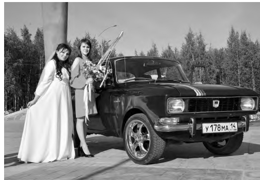
Внучки возле машины деда