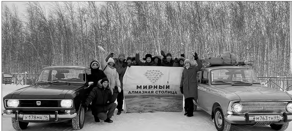
Мирный встречает путешественников.

Александр. Сам, будучи северянином, я знаю, как проводят отпуск северяне. В первый день отпуска они садятся в самолет или автомобиль и уезжают куда-нибудь на юг. Так что северяне все – путешественники. С Ямала я стал ездить на машине в отпуск и к 1990-м уже изъездил всю страну, побывал везде, где были автомобильные дороги. Начиная с «Москвича», потом ездил на «Волгах», на «Жигулях».