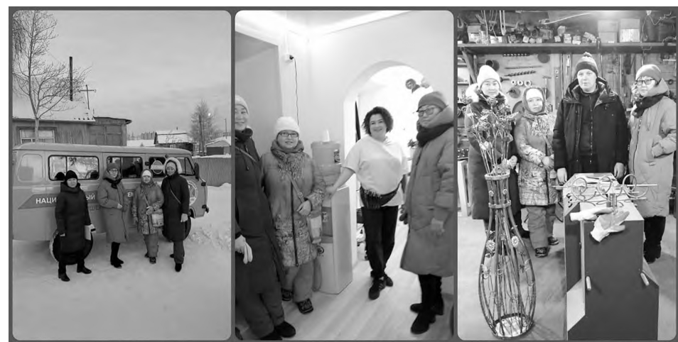
Благодаря социальному контракту семьи Мирнинского района открыли свое дело в сфере красоты, торговли и производственной деятельности.

За последние пять лет объем финансирования на поддержку материнства и детства в Якутии возрос в разы и сейчас превышает 29 миллиардов рублей в год. Меры показывают реальную результативность: в регионе увеличилось количество детей, рожденных третьими и последующими.