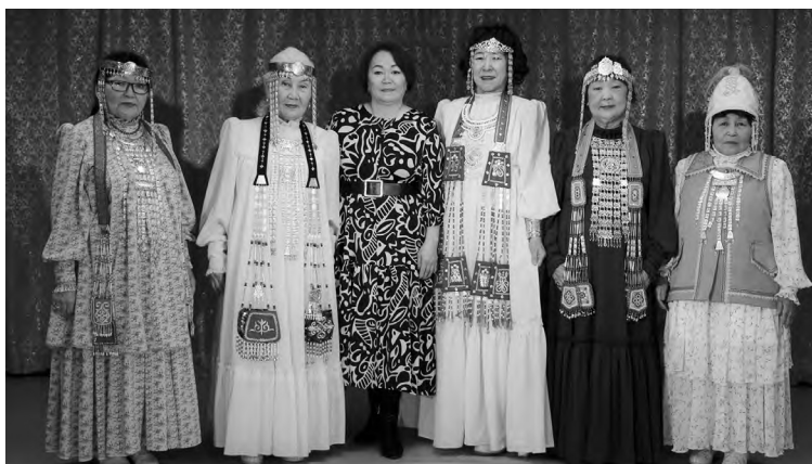
В Арылахе пенсионеры собираются в свой дружный круг.