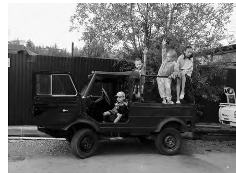
Дети готовы к путешествию

Немного истории. Достоинство ЛуАЗа – это то, что изначально внедорожник создавался для военных (модель 967). Соответственно, в гражданской версии он несильно изменился. Машина не отличается комфортом, зато проходимость у нее даже в базе поражает, хотя у нее маломощный двигатель. Автомоби-