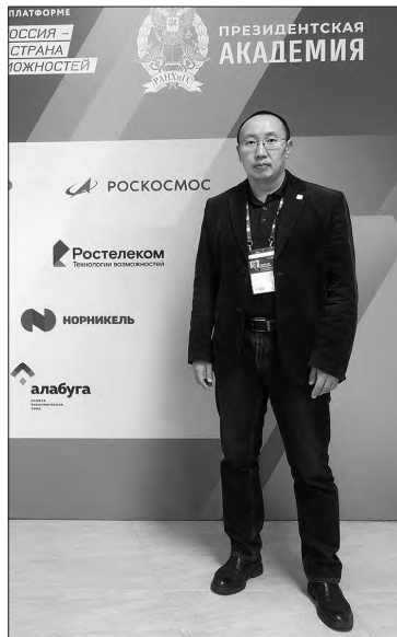
В 2023 году в окружном финале ДВФО 5-го конкурса «Лидеры России» во Владивостоке