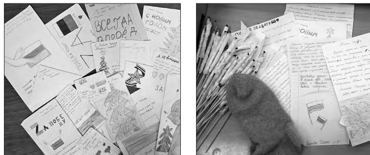
📍 Эти письма от детей со словами поддержки для солдат отправятся в зону проведения специальной военной операции

Мы знаем, что военнослужащие обеспечены всем необходимым. Но в то же время понимаем, что, находясь там, «за ленточкой», нашим ребятам нужно нечто большее, чем положено по уставу – наша задача им это обеспечить», – рассказала Виктория Вячеславовна.