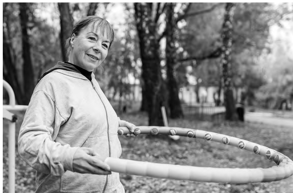
📷 Занятия спортом – это часть физической активности, где человек подбирает для себя нагрузку

Многим людям с повышенным давлением не рекомендуются тяжелые физические нагрузки, а ежедневные пешие прогулки не только допустимы, но еще и очень полезны.