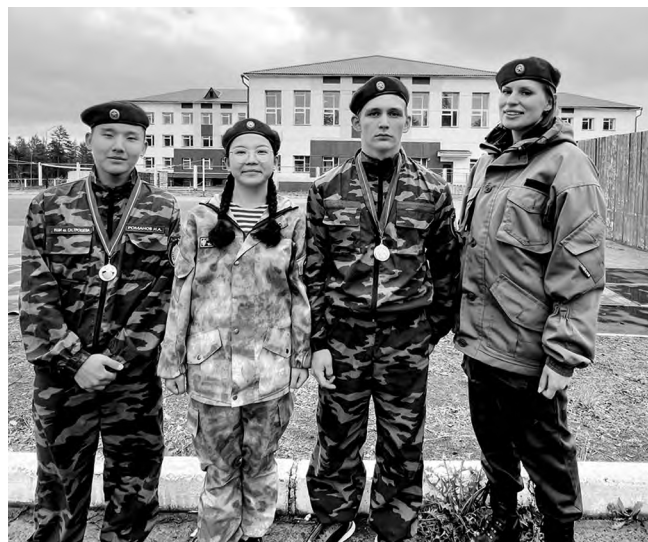
Насыщенные будни лагеря