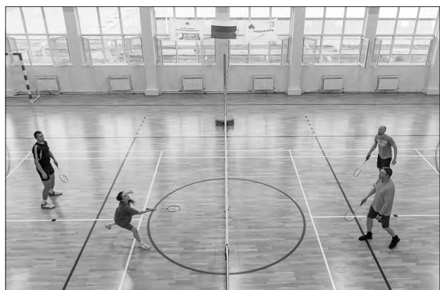
В физкультурно-оздоровительном комплексе часто проводят соревнования по игровым видам спорта – отличный отдых после работы.