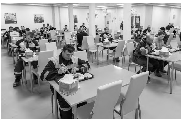
В светлой и уютной столовой приятно находиться! Нефтяникам готовят профессиональные повара, а все блюда соответствуют ГОСТу.