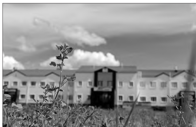
Для вахтовиков создан вахтовый жилой комплекс с благоустроенными общежитиями.

27 апреля отметили День вахтового работника. В «Таас-Юрях Нефтегазодобыче» на Среднеботуобинском месторождении сотни нефтяников трудятся вдали от дома. Следуя политике социальной ответственности «Роснефти», «Таас-Юрях Нефтегазодобыча» планомерно улучшает социально-бытовые условия своих работников.