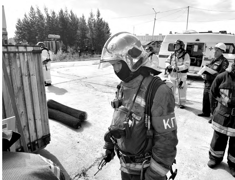
Учения. Физическая подготовка для пожарных очень важна.

Они не считают себя героями, но запросто шагнут в горящий дом. Для них спасение людей – это работа, а самообладание – главное качество. Каждый день мы наблюдаем героический труд наших пожарных и их преданность своему делу в сухих строках сводок происшествий.