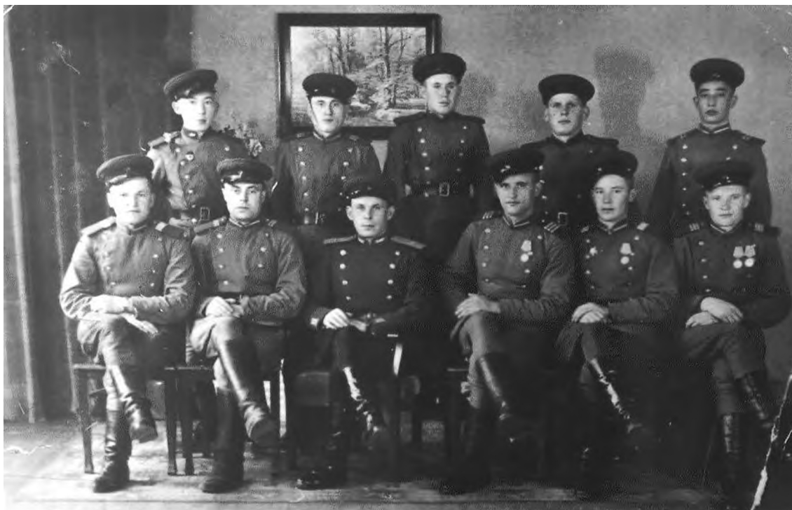
Потсдам. Коллективное фото охраны

А работа, между тем, была очень трудной. По воспомина-