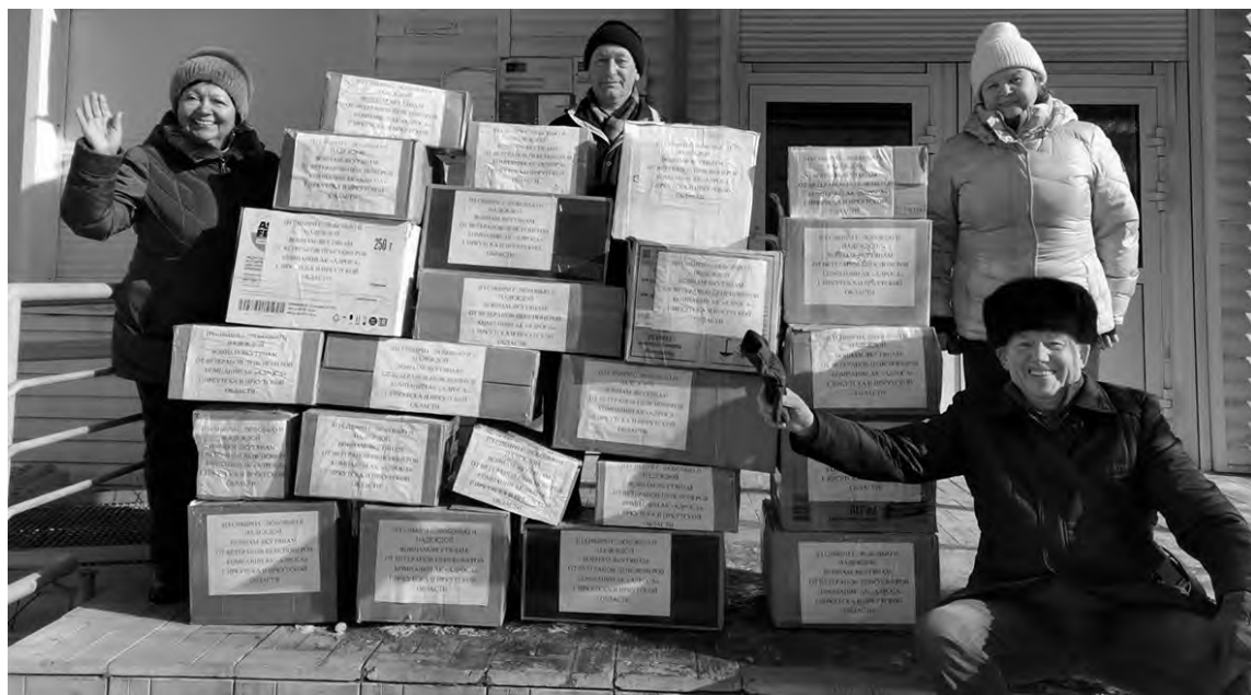
Надпись на каждой посылке: «Из Сибири с любовью и надеждой воинам-якутянам от ветеранов-пенсионеров АЛРОСА г. Иркутска и Иркутской области»

Мы, ветераны алмазодобывающей промышленности, очень обеспокоены этой непростой ситуацией, с болью и тревогой воспринимаем все новости с полей сражений. Некоторые из нас еще помнят время Великой Отечественной войны, суровое и тяжелое детство. Всей душой и сердцем сопереживаем этим событиям в нашей стране,