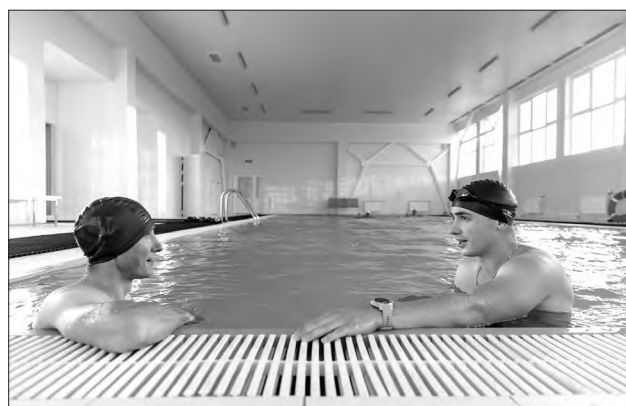
В физкультурно-оздоровительном комплексе созданы игровые залы, бильярдная, бассейн, сауна, комнаты отдыха.