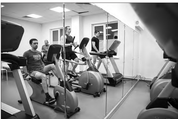
Тренажерный зал пользуется популярностью!