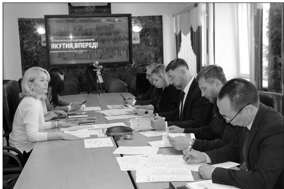
Заседание конкурсной комиссии

Согласно указу главы республики о единой системе кадровых резервов в Якутии проводится конкурс «Якутия, вперед!». Он был объявлен весной текущего года.